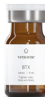
VENOME MESO BTX

Zmarszczki mimiczne występują praktycznie na skórze każdego. Brak odpowiedniego nawilżenia skóry dodatkowo je podkreśla. Mięśnie twarzy w ciągu dnia wykonują około 15 tysięcy ruchów , które pojawiają się w momencie uwolnienia bodźca wysyłanego przez mózg w postaci impulsów nerwowych do docelowych mięśni. W chwili zetknięcia się impulsu nerwowego, biegnącego przez włókna doprowadzające, ze złączem mięśniowym (płytką nerwowo-mięśniową) następuje intensywne wydzielanie acetylocholiny zwanej neuroprzekaźnikiem, która rozprzestrzenia sygnał na całej płaszczyźnie mięśnia, co skutkuje jego pełnym skurczem. Powtarzalność tego schematu powoduje ciągłe napężanie i rozprężanie skóry, przez co powstają nowe linie zmarszczek mimicznych, a reszta załamów stale pogłębia się. Zastosowanie unikalnego połączenia czystego kwasu hialuronowego oraz produktu peptydowego BTX pozwoli wygładzić powierzchnie nierówności skórne oraz przywrócić skórze odpowiednią jędrność i napięcie.