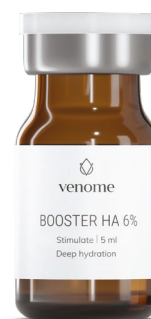
VENOME STIMULATE BOOSTER HA 6%