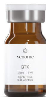
● VENOME MESO BTX