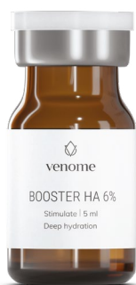
● VENOME STIMULATE BOOSTER HA 6%