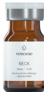
VENOME MESO NECK

Prosty krok w walce o piękną i jędrną szyję. Meso NECK to wysoce skuteczny koktajl składników aktywnych, które zapewniają skuteczną regenerację i poprawę wyglądu skóry szyi.